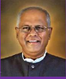
Dr. G M Siddeshwara Hon'ble Member of Parliament, Davanagere District