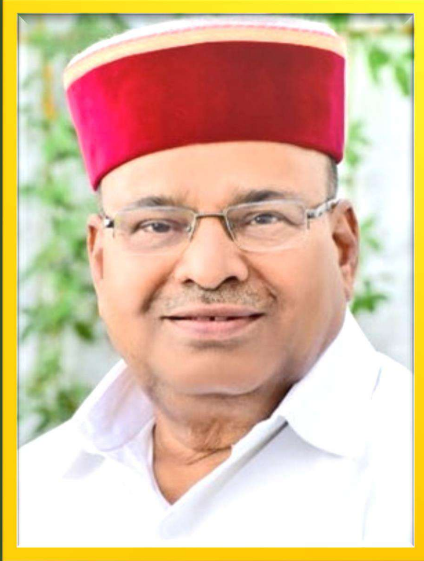
Hon'ble Shri Thaawarchand Gehlot The Governor of Karnataka & Chancellor of VTU President of the Programme