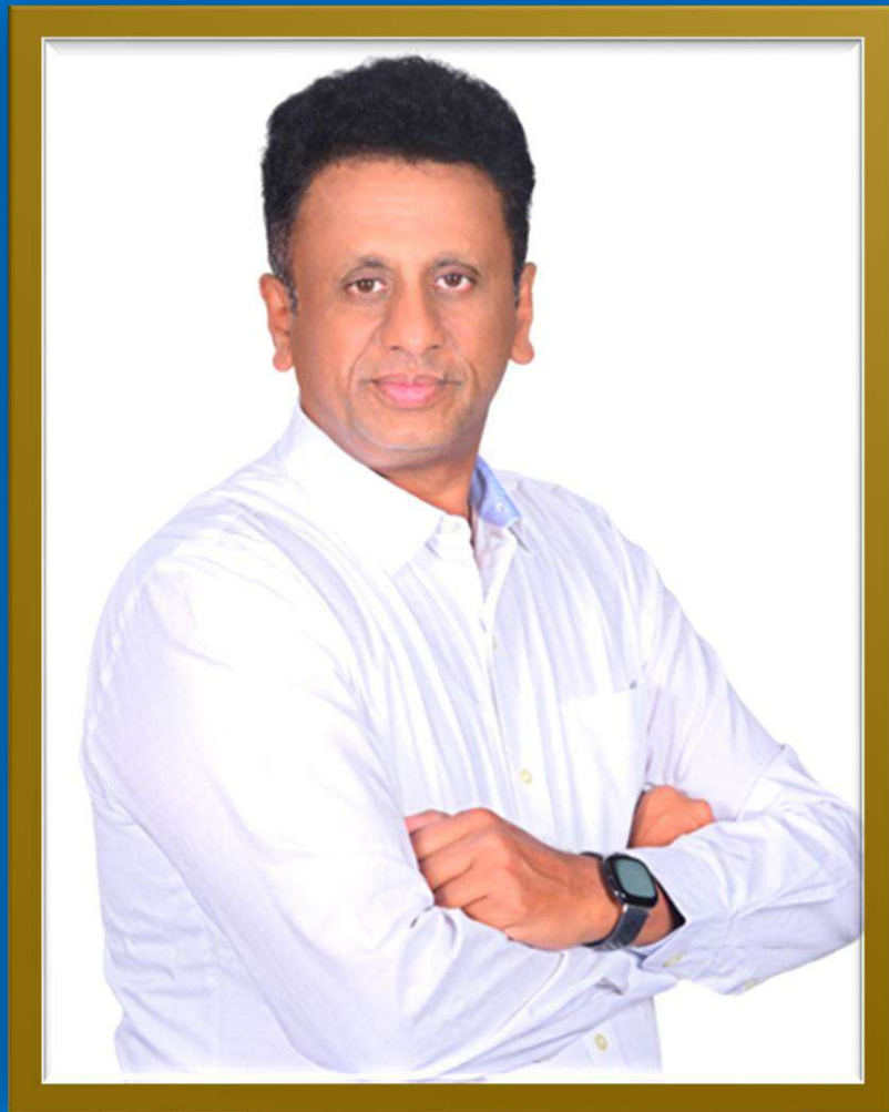
Dr. M C Sudhakar

Hon'ble Minister for Higher Education and Chairman, Karnataka State Higher Education Council Government of Karnataka