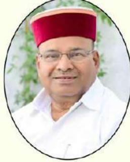
ಶ್ರೀ ಧಾವರ್ಚಂದ್ ಗೆಲ್ಲೋಟ್ ಗೌರವಾನ್ವಿತ ರಾಜ್ಯಪಾಲರು, ಕರ್ನಾಟಕ