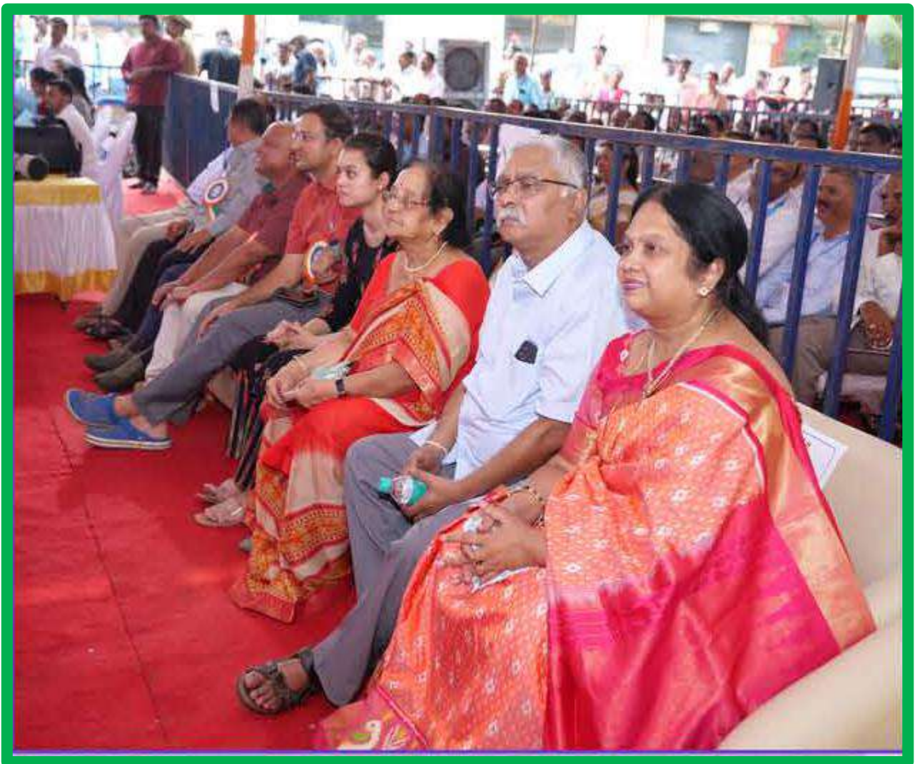
Donors Family Members are participated in the inaugural function of Platinum Jubilee Celebration