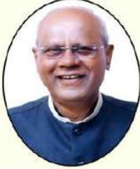
ಡಾ. ಬಿ.ವಿ. ಸಿದ್ದೇಶ್ವರ ಮಾನ್ಯ ಸಂಸದರು, ದಾವಣಗೆರೆ ಲೋಕಸಭಾ ಕ್ಷೇತ್ರ